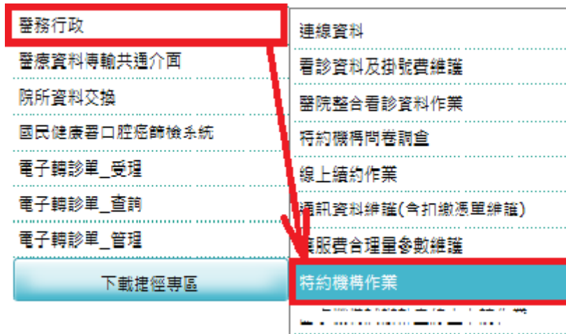
圖 3 從醫務行政點選特約機構作業